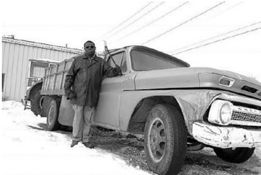
Photographié par : Don Healy, Leader-Post

Copyright 2008 The LeaderPost. Utilisé avec la permission